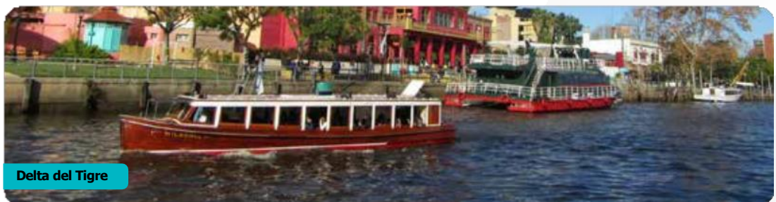
Delta del Tigre