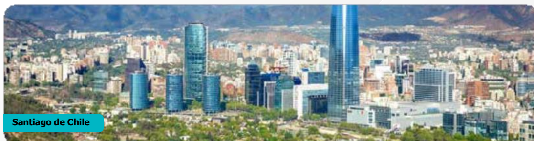
Santiago de Chile